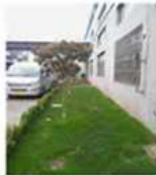
改善后的绿色草地 四季的绿色